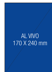
IV di copertina